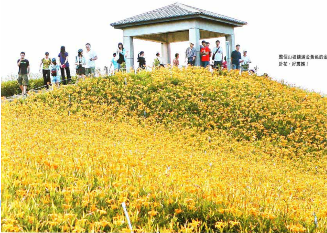
整個山坡鋪滿金黃色的金針花，好震撼！

明明都只是金針花，攻上山頂欣賞，往花叢中鑽，走到觀景台遠眺，就是看不厭，竟忘了肚餓。離不開那片橘黃色，三點鐘才吃的午餐，也要到花海中的鐵掌櫃茶舍，把金針花吃下肚。感覺到滿目滿口都嘗盡了幽香，再捨不得也心息了！