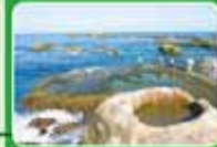
▲石梯坪的海蝕地形，總會吸引遊客漫步觀賞奇景。

註：1. 以上價格只有單純交通費用，不含食、宿、門票。 2. 油資價格是詢問各地計程車司機，以1公升汽油換算8公里車程估算。 3. 計程車旅遊路線若業者配合，請於1周前預約。