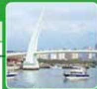
▲淡水漁人碼頭是北部最受歡迎的旅遊漫步景點。