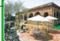
▲位於西子灣的打狗英國領事館是高雄觀光景點。